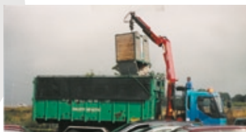
Collecte des points recyclage