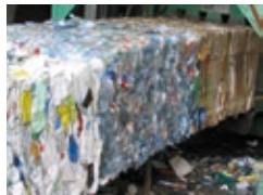
Mise en balles avant transport vers les usines de recyclage.