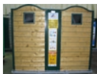
La Richardais Pleurtuit Saint-Briac sur Mer Saint-Lunaire